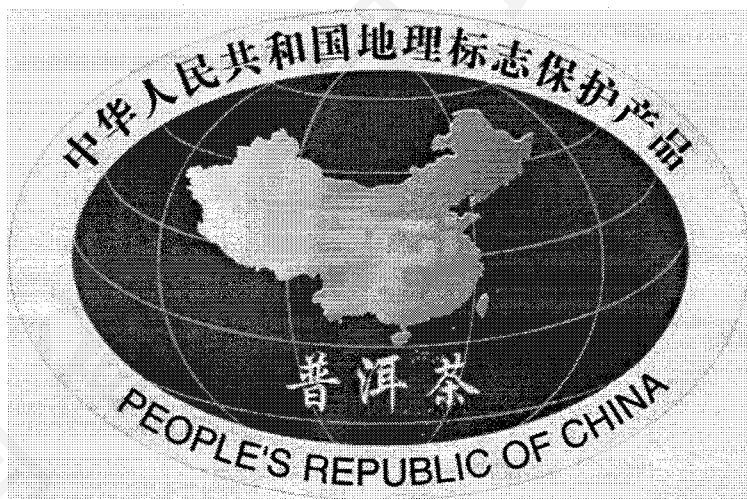
图 1：普洱茶地理标志保护产品普洱茶专用标志

普洱茶地理标志保护产品普洱茶专用标志见图 1。标志的轮廓为椭圆形，淡黄色外圈，绿色底色。椭圆内圈中均匀分布四条经线、五条纬线，椭圆中央为中华人民共和国地图。在外圈上部标注“中华人民共和国地理标志保护产品”字样；中华人民共和国地图中央标注“PGi”字样；在外圈下部标注“PEOPLE'S REPUBLIC OF CHINA”字样。在椭圆型第四条和第五条纬线之间中部标注受保护的地理标志产品名称，即“普洱茶”。